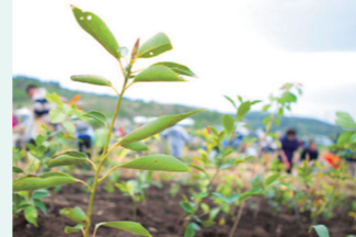
神奈川県「湘南国際村めぐりの森」